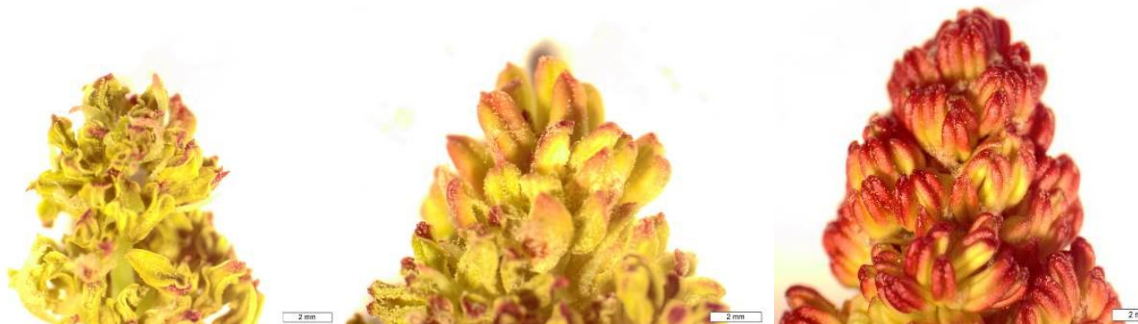
شکل ۵. مراحل مختلف آمادگی کلاله گل ماده جهت پذیرش دانه گرده تا اتمام آن (تصویر بالا) و مراحل مختلف شروع تا پایان گرده افشانی گل های نر (تصویر پایین).