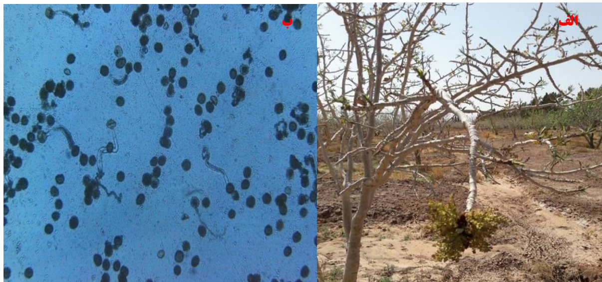
شکل ۱۵. قدرت جوانه‌زنی پایین دانه‌های گرده (الف) به همراه عدم تشکیل جوانه گل کافی (ب) در اثر شرایط نامساعد محیطی.

عامل اصلی سال آوری درختان پسته ناشی از رقابت کربوهیدراتی بین میوه و اندام‌های رویشی و جوانه‌های زایشی تمایز یافته روی آن می‌باشد. بنابراین در صورت مدیریت صحیح، سال آوری در درختان نر قابل کنترل بوده و کم‌رنگ می‌گردد. اما در سال‌های اخیر عدم تأمین نیاز سرمایی در برخی درختان نر دیرگل از یک سو و بالا بودن دمای هوا در زمان تمایز و تشکیل جوانه‌های گل در فصل بهار از سوی دیگر سبب کاهش تعداد گل‌های نر گردیده است (شکل ۱۲).