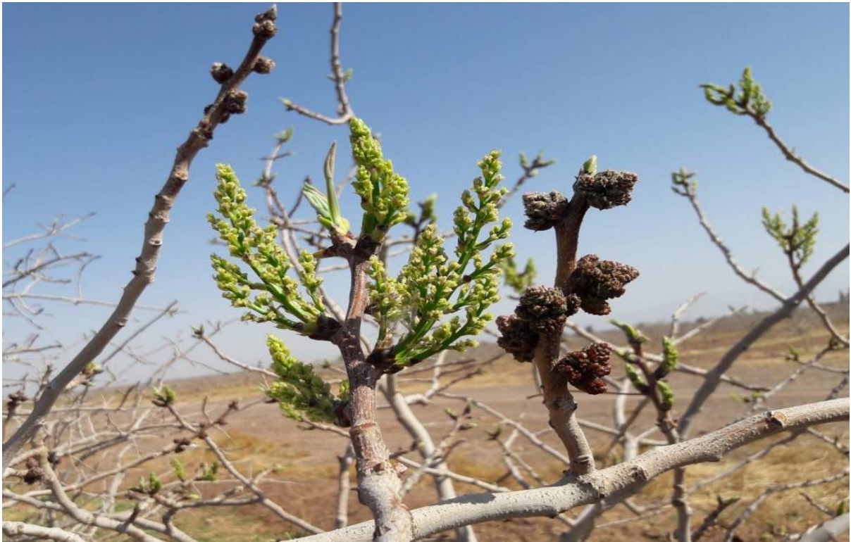
شکل ۱۰. عدم هم‌زمانی در گل‌دهی رقم احمدآقایی زودگل با یک نر دیرگل. این درخت نر سهمی در افزایش ارزش اقتصادی باغ ندارد.