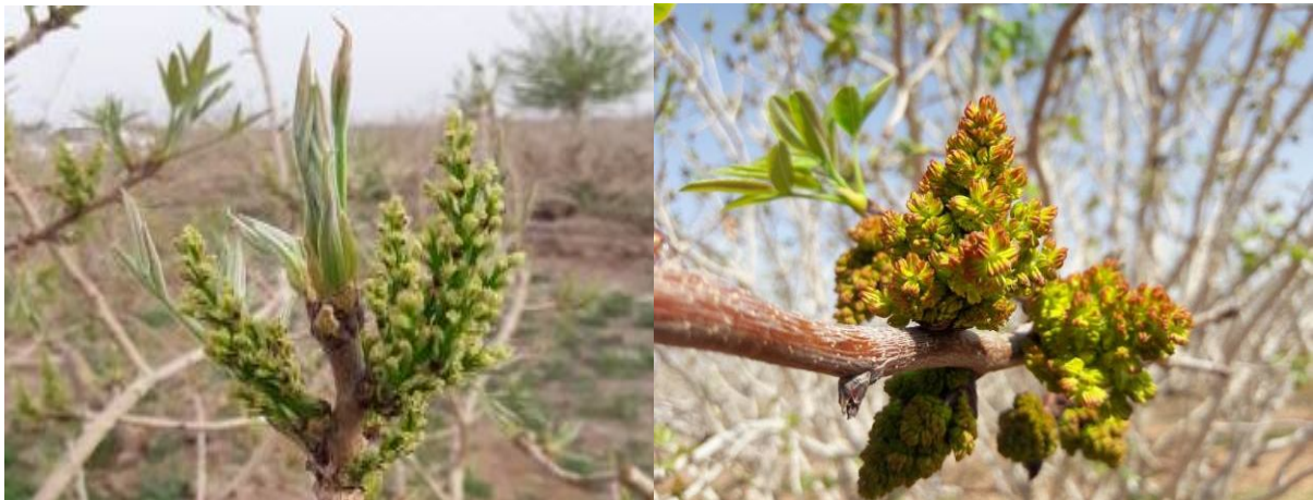
شکل ۸. گل آذین نر (سمت چپ) و گل آذین ماده (سمت راست) پسته که آماده شروع فرآیند گردهافشانی و تلقیح می‌باشند.