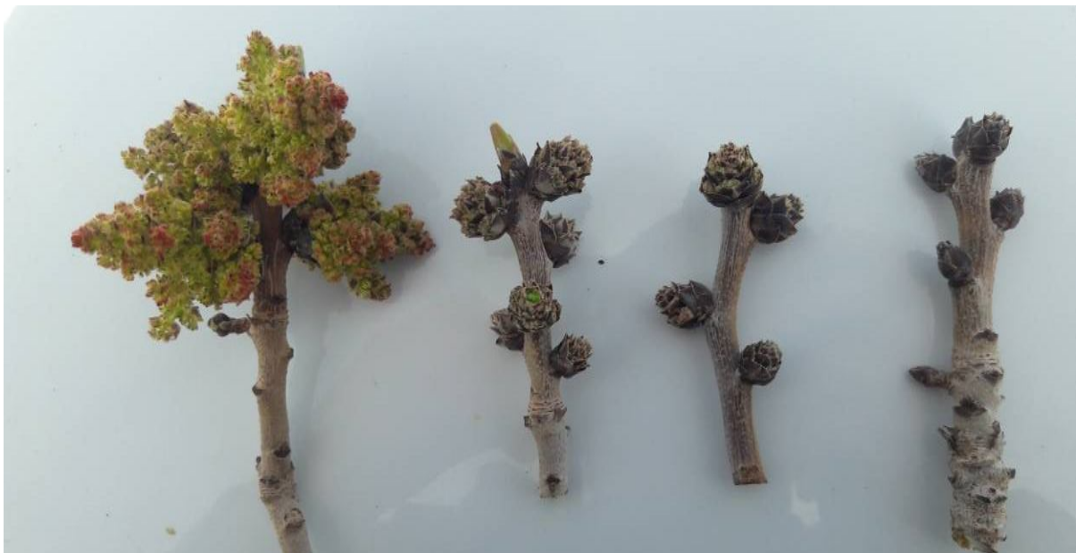
شکل ۱۶. تنوع در زمان گل‌دهی درختان نر موجود در یک باغ کله‌قوچی؛ زمان گل‌دهی درخت نر اول و آخر در این تصویر با گل‌دهی رقم کله‌قوچی مطابقت نداشته و عملاً سهمی در بهبود فرآیند گرده‌افشانی باغ ندارند.