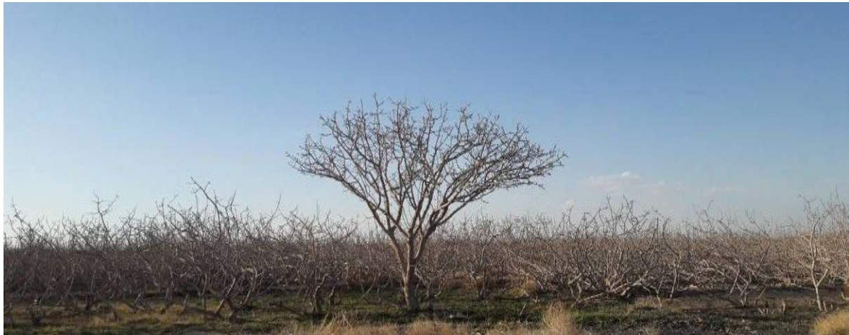
شکل ۱۴. تربیت درختان نر بهتر است به صورت تک تنه و افراشته صورت گیرد.