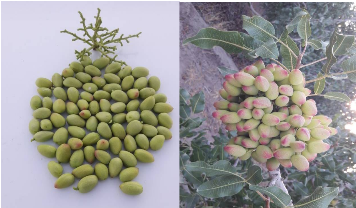
شکل ۴. تشکیل تعداد مناسبی از میوه در خوشه رقم کله قوچی که نشان از گرده افشانی موفق در باغ دارد.

بدون وجود دانه گرده امکان پذیر نیست. پس از اتمام فرآیند گرده افشانی و تلقیح، جداره تخمدان که سه برچه‌ای است شروع به رشد کرده و کم کم میوه‌های پسته ظاهر می‌شوند که باغداران از آن به نام مرحله ارزنی یا ارزنو نام می‌برند. اگر گرده افشانی اتفاق نیفتد و گل‌های نر و ماده در هم نیامیزند، درصد زیادی از گل‌های ماده پس از یک رشد اولیه شروع به ریزش می‌کنند. دلیل این ریزش، عدم دریافت پیامی از جنین تلقیح نشده توسط گیاه می‌باشد که منجر به حذف و ریزش آن میوه غیربارور طی مکانیسمی هوشمند می‌گردد. با این وجود تعداد کمی از گل‌های تلقیح نشده همچنان به رشد خود ادامه داده و میوه‌های پوک و بدون مغز (پارتنوکارپ) را تشکیل می‌دهند که اکثراً تا پایان دوره رشد روی درخت باقی می‌مانند. وجود این میوه‌های پوک سبب هدر رفت بخش قابل توجهی از مواد غذایی و انرژی گیاه می‌گردد؛ زیرا رشد و توسعه محور خوشه و جدارهای میوه (پریکارپ) درختان پسته نیازمند حجم زیادی از مواد غذایی و محصولات فتوسنتزی است. بنابراین عدم گرده افشانی مناسب در باغ‌های پسته خود را به صورت ریزش کامل خوشه‌ها، تنک و کم دانه شدن خوشه‌ها و افزایش میزان پوکی نشان می‌دهد که مجموع آنها سبب کاهش عملکرد اقتصادی باغ می‌گردد.