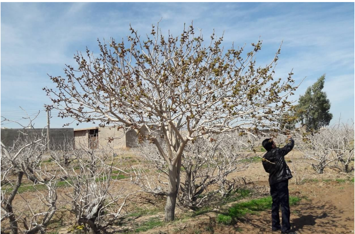
شکل ۱۱. اگرچه این درخت نر دارای تعداد زیادی گل می‌باشد اما زمان گل‌دهی آن با رقم تجاری باغ هم‌پوشانی ندارد. جهت انجام گرده‌افشانی تکمیلی بهتر است گرده‌ها از این نوع درختان جمع‌آوری شوند.