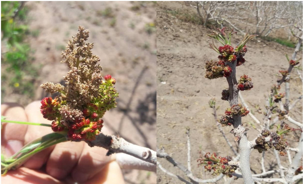
شکل ۱۳. خسارت سرما به گل‌های نر پسته در اسفند سال ۱۳۹۸