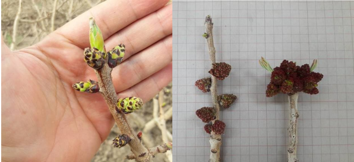
شکل ۷. گل‌های نر (سمت چپ) و ماده (سمت راست) قبل از ورود به مرحله شروع گردهافشانی