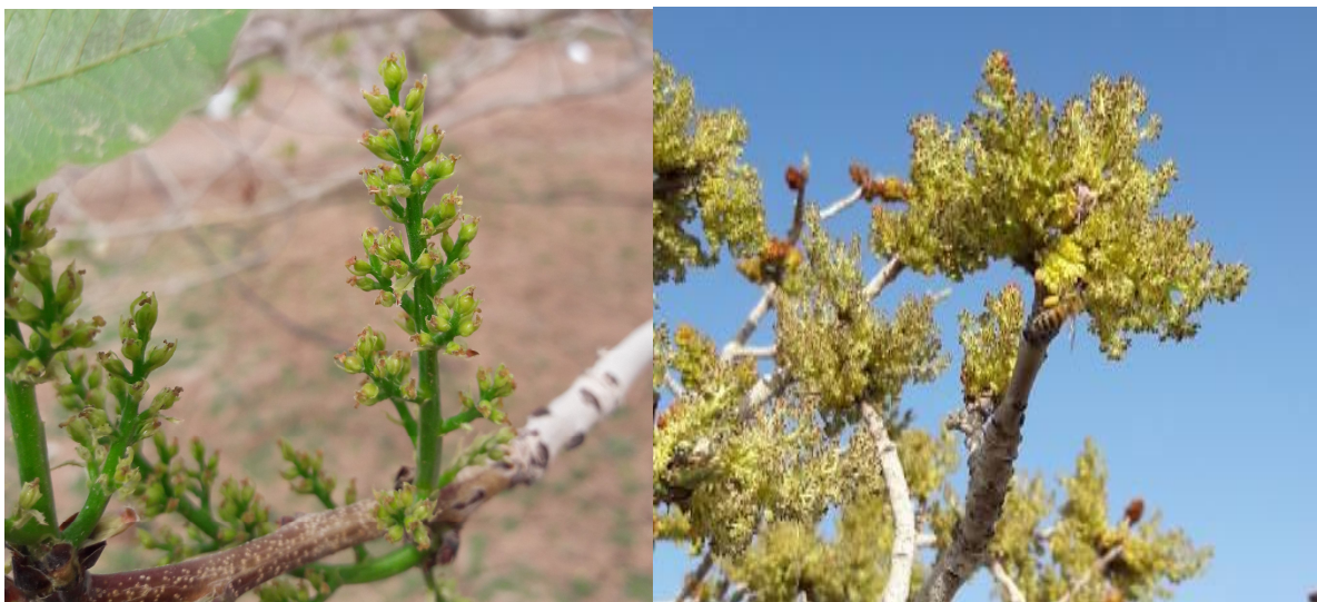
شکل ۹. گل آذین نر (سمت چپ) و گل آذین ماده (سمت راست) پسته پس از اتمام گل‌دهی که با پاره شدن بساک و تخلیه دانه گرده از تمامی گل‌های نر و همچنین خشک شدن کلاله گل ماده و رشد میوه همراه است.