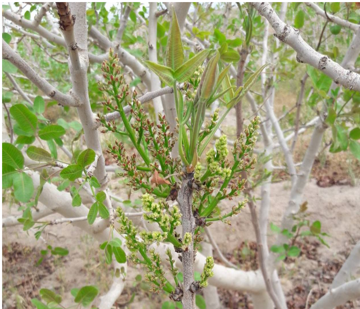
شکل ۱۲. عدم یکنواختی در آغاز گل‌دهی روی یک درخت ماده که لذوم طولانی بودن طول دوره گل‌دهی درختان نر جهت هم‌پوشانی کامل گل‌دهی درختان ماده را آشکار می‌سازد.

همانطور که پیش از این گفته شد، علاوه بر توجه به هم‌پوشانی زمان گل‌دهی درختان نر و ماده، باغداران پسته کار باید به تعداد گل در هر درخت و حجم دانه‌گرده تولیدی در هر گل و مهم‌تر از آن به قدرت جوانه‌زنی دانه‌های گرده توجه ویژه‌ای داشته باشند. زیرا درختان متعددی توسط نگارندگان در مناطق پسته‌خیز کشور مشاهده گردیده که دانه‌های گرده آنها از قدرت جوانه‌زنی و زنده‌مانی پایینی برخوردار بوده‌اند. همچنین درختان نری که عادت رشدی آنها به حالت افراشته یا نیم افراشته می‌باشد، بر درختان نر با عادت رشدی گسترده ارجحیت دارند (شکل ۱۱).