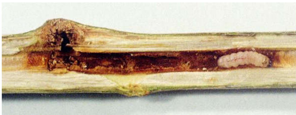
شکل ۴- لارو آفت در ساقه یک ساله صنوبر

علائم رایج زیر نشان می‌دهد که گیاهان میزبان آلوده به P. tabaniformis هستند: تورم (گال) روی ساقه‌ها و شاخه‌ها، سوراخ‌های ورودی لارو با پارگی بافت بیرون زده، سوراخ‌های خروجی حشرات بالغ با پوست شفیرگی و شکستگی ساقه. لاروها ابتدا از پوست داخلی تغذیه می‌کنند و بعداً به داخل ساقه‌های صنوبر فرو رفته و دالان‌هایی در چوب ایجاد می‌کنند. در نهالستان، نهال‌های صنوبر یک ساله آلوده، گال‌های متقارن را در نقاط تغذیه لارو تشکیل می‌دهند. این گال‌ها تا پایان دوره رشد گیاه به کندی رشد می‌کنند. گیاهان میزبان آلوده با سوراخ‌های خارجی دالان‌های لاروی همراه فضولات حشره (مواد دفعی و ذرات چوب) مشخص می‌شوند. در مزارع کشت صنوبر، درختان دو و سه ساله آلوده با تورم موضعی در نقاط آلوده قابل تشخیص هستند. در حالی که درختان قدیمی‌تر بدون تورم هستند. پس از ظهور حشرات بالغ، سوراخ‌های خروجی با بخشی از پوست شفیرگی به وضوح قابل مشاهده است. همچنین از سوراخ‌های خروجی دالان‌های لاروی فضولات خارج می‌شود. لاروهای نسل‌های مختلف آفت می‌توانند در طی سال‌های متوالی در یک مکان رشد کنند. در این مورد، منافذ بیرونی بزرگی در نقاط آلوده ایجاد می‌شوند.