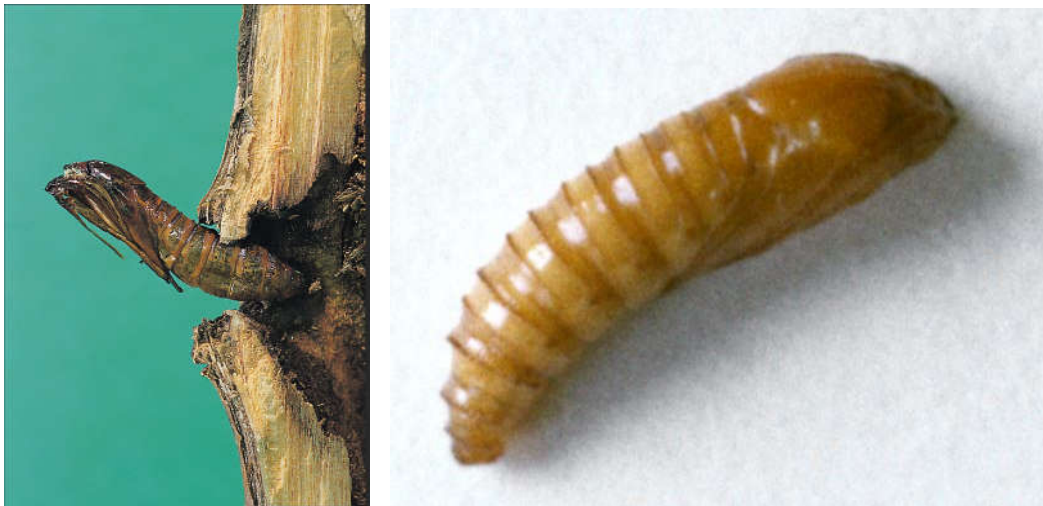
شکل ۳- شفیره P. tabaniformis در ابتدای رشد آن (چپ)