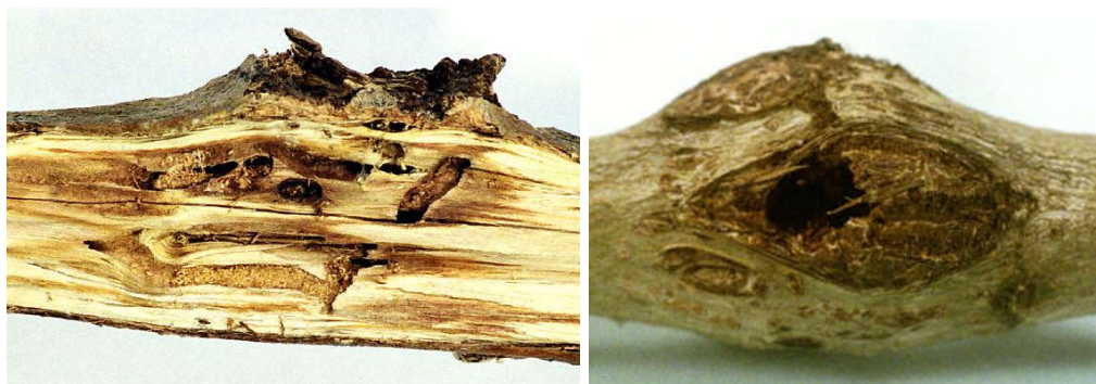
شکل ۵- سوراخ بیرونی دالان‌های لارو روی ساقه صنوبر سه ساله (راست) و دالان لاروی آفت در ساقه صنوبر پنج ساله (چپ)