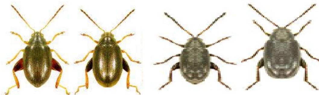
شکل ۱- حشره کامل جنس Phyllotreta (تصاویر سمت راست، ماده و نر از راست به چپ)، حشره کامل جنس Psylliodes (تصاویر سمت چپ، ماده و نر از راست به چپ)

براساس بررسی های بعمل آمده در کشور ما بیشترین خسارت مربوط به دو جنس Psylliodes spp. و Phyllotreta spp. در کلزای کشت پاییزه (در اکثر مناطق ایران) می باشد (کیهانیان، ۱۳۸۷) (شکل ۱)، در حالی که این گونه ها در غالب کشورهای، به زراعت کلزای بهاره خسارت می رسانند.