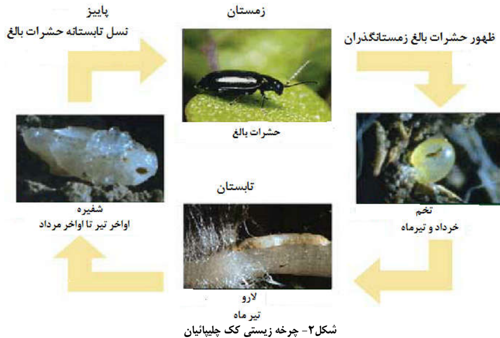
شکل ۲- چرخه زیستی کک چلیپانیان

۲). با رسیدن فصل سرما و رشد گیاهان میزبان، معمولاً تغذیه به حداقل می رسد و در اواخر پاییز بسته به شرایط آب و هوایی مناطق مختلف، سوسک ها به مناطق زمستان گذران پناه می برند (Maurya, 1998؛ کیهانیان، ۱۳۸۷ و Lamb, 1989& 1984).