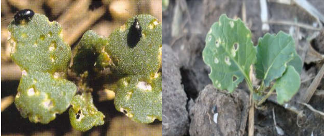
شکل ۳- نحوه خسارت کک چلیپانیان