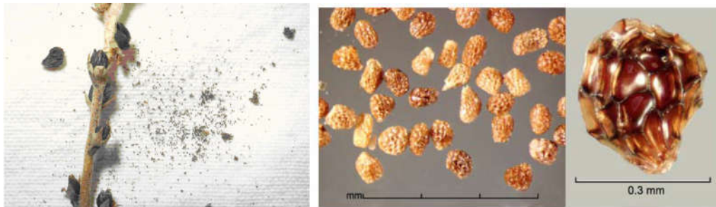
شکل ۲- بذر گل جالیز

چرخه زندگی گل جالیز با بذر شروع می‌شود (شکل ۲). بذر از طریق تحریک مواد مترشحه ریشه گیاه میزبان شروع به جوانه زدن می‌نماید و پس از اتصال به ریشه گیاه میزبان زندگی خود را ادامه می‌دهد. هر بوته گل جالیز حدود ۲۵۰ هزار بذر بسیار ریز تولید می‌کند. اغلب بذرها گل جالیز دارای خواب اولیه هستند. حداکثر فاصله بذر از ریشه میزبان برای تأثیر پذیری از مواد محرک جوانه زنی دو سانتی‌متر می‌باشد. پس از جوانه زدن بذر گل جالیز، رشته اولیه از درون پوسته بذر خارج می‌شود و اطراف ریشه گیاه میزبان استقرار می‌یابد. نفوذ به داخل ریشه میزبان از طریق ترشح آنزیم‌ها و همچنین فشار مکانیکی سلول‌های مکینه صورت می‌گیرد که موجب جدا شدن سلول‌ها از یکدیگر می‌شوند (شکل ۳).