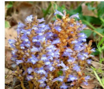
Phelipanche nana (Noë ex Rehb.) Soják