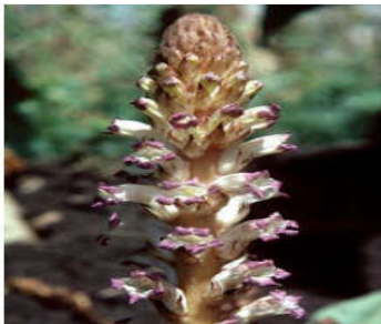
Orobanche cernua Loefl.