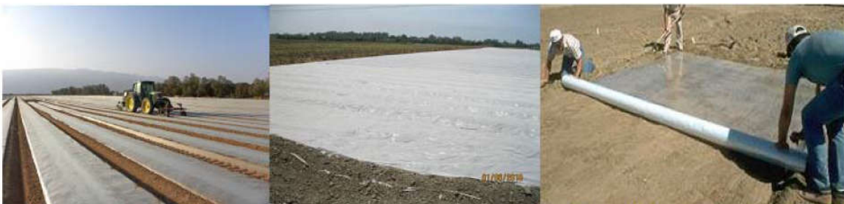
شکل ۴- آفتاب دهی خاک (Soil Solarization)