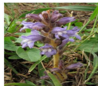
Phelipanche oxyloba (Reut.) Soják