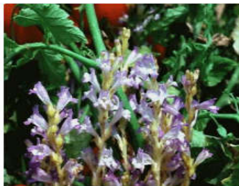
Phelipanche aegyptiaca (Pers.) Pomel.

تعداد ۳۶ گونه گل جالیز در ایران موجود می‌باشد. در بین گونه‌های موجود در ایران گونه‌های Phelipanche aegyptiaca ، Phelipanche ramosa ، Phelipanche cernua ، Phelipanche muteli و Phelipanche oxyloba خسارات قابل توجهی را در نقاط مختلف کشور به محصولات زراعی، سبزیجات، صیفی‌جات و درختان میوه وارد می‌کنند (شکل ۱).