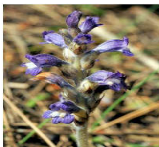
Phelipanche muteli F.W.Schult