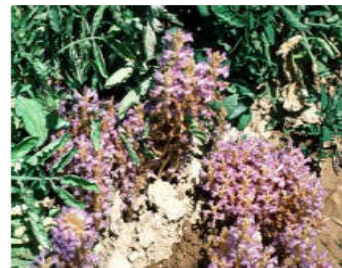
Phelipanche ramosa (L.)